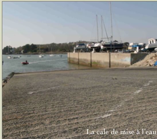
La cale de mise à l'eau